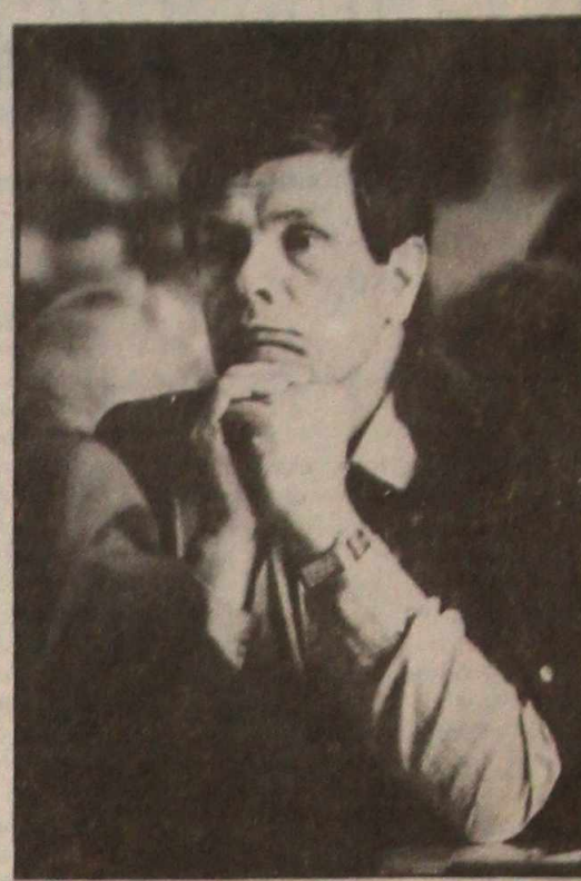
Ідзе партыйны сход...

Рэпартаж з філалагічнага факультэта падрыхтаваў С. Плытквіч.